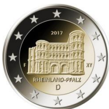
Duitsland Porta Nigra