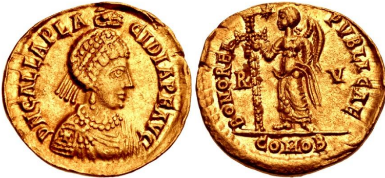
Galla Pacidia (421-450)/Victoria, Au solidus, Ravenna, 439

Nadat generaal Constantius de Visigoten (421) had verslagen kreeg hij Galla Placidia als vrouw toegewezen. Ook hier had de bruid niets in te brengen. Door dit huwelijk werd hij keizer Constantius III (421).