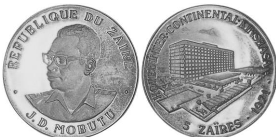
5 zaïre hotel InterContinental 1971, zilver Ø 36 mm

Mobutu liet ook enkele prestigeprojecten realiseren. Zo liet hij het 5 sterrenhotel InterContinental bouwen te Kinshasa in 1971. Het management werd toevertrouwd aan de InterContinental Hotels Corporation van 1971 tot 2000. Het is het grootste en meest luxueuze hotel van heel Congo. Vandaag heet het Grand hôtel de Kinshasa . In 1971 werden ook gelegenheidsmunten uitgegeven van 5 tot 50 zaïre in zilver, goud en platina.