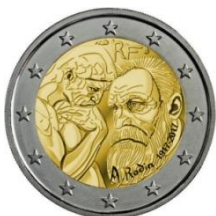
Frankrijk Auguste Rodin