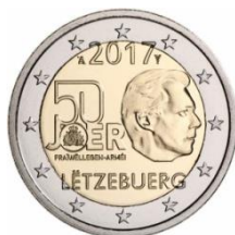
Luxemburg 50j Vrijwilligersleger

Ook in 2017 komt er uiteraard weer van alles op ons af, met o.a.: