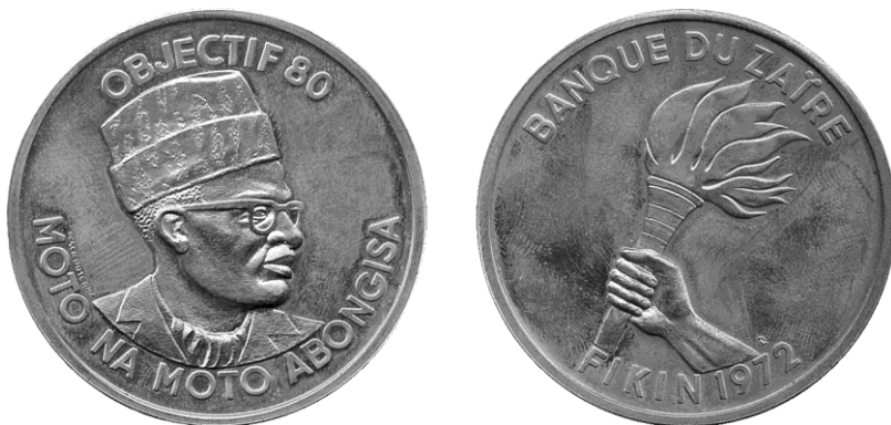
Medaille FIKIN (Foire Internationale Kinshasa) 1972, MOTO NA MOTO ABONGISA = iedereen moet het juiste doen Ø 50 mm goud 50 ex., Ø 31 mm goud 50 ex., proefslagen in brons

Hij graveerde ook 3 portretten van Mobutu: 10 makuta 1973-78, deze 20 makuta en de 1, 5 en 10 zaïre 1987-88, evenals medailles met het hoofd van Mobutu: FIKIN 1972 en de 60 ste verjaardag van Mobutu 1990.