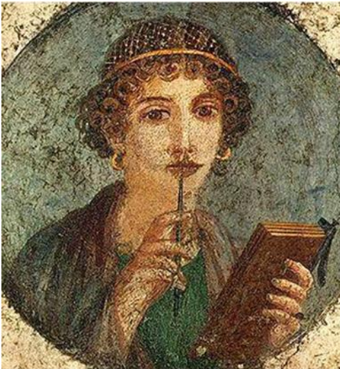
Onderwijs: Vrouw met griffel (Pompeii)

De Romeinse vrouw zat daar een beetje tussenin, hoewel hier nog steeds geen eenduidig beeld van is. Ze stond eigenlijk altijd onder curatele van vader of echtgenoot, mocht niet stemmen noch een publiek ambt uitoefenen, ook in het leger had zij geen rol. Daartegenover lijken er toch aanwijzingen te zijn dat ze wel bezit kon hebben, ze mocht erven en geld investeren. Ze mocht beroepen uitoefenen en mocht scheiden, daarnaast hadden vrouwen recht op onderwijs en vervulden zij rollen in de kunst, in de godsdienst (o.a. Vestaalse maagden) en in het lokaal bestuur.